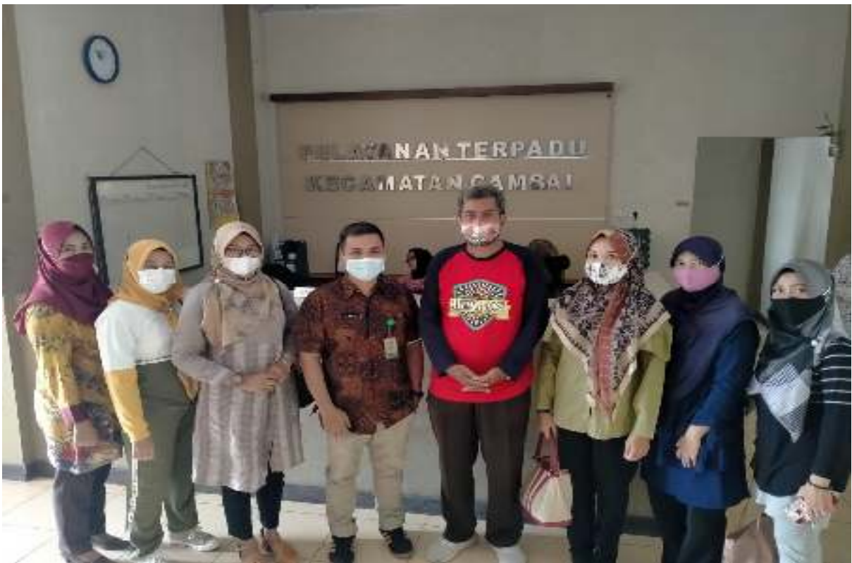
Foto Bersama di Front Office Paten Kecamatan Cambai