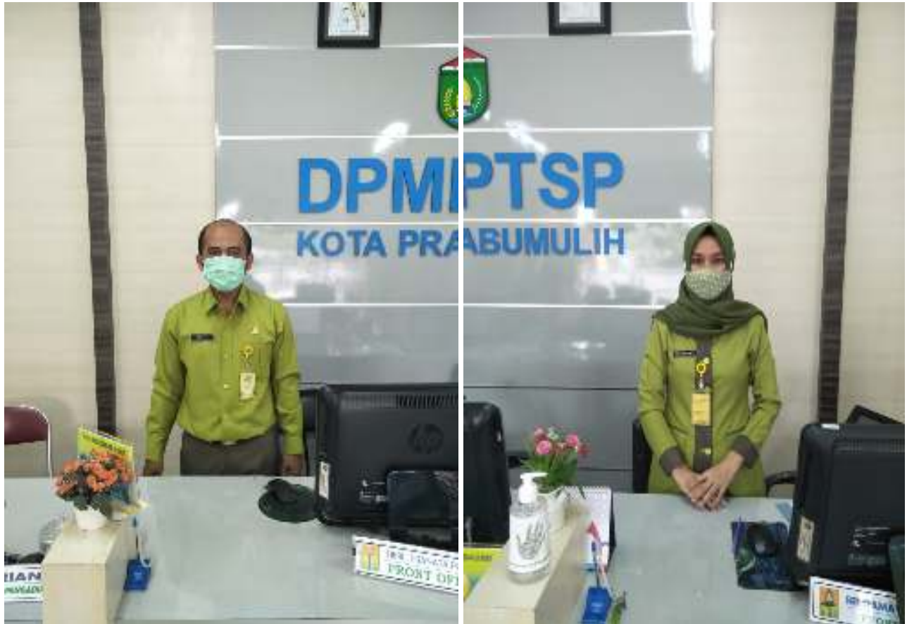
Foto Petugas Front Office DPMP TSP KOTA PRABUMULIH