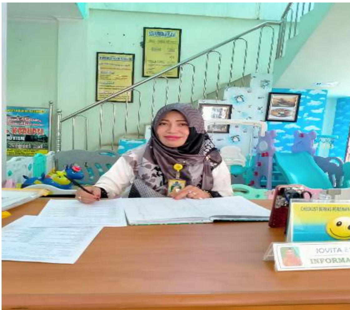
Petugas informasi layanan dan Pengaduan